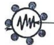
Document 2 :

1°/ Légendez et titrez ces deux schémas. (04 pts)